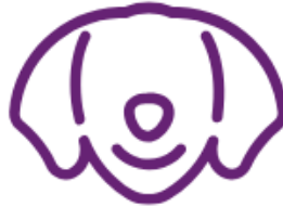
Mascota en Cabina