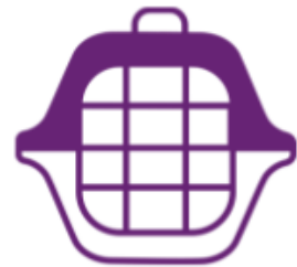
Mascota en Bodega