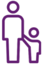
Menor no Acompañado

El resto de los Servicios Especiales ( UMNR, AVIH, PETC, etc. ) que tienen asociado un costo, el agente de viajes deberá solicitarlo a través del Soporte Agencias o el pasajero podrá solicitarlo a través de los canales de atención directos de SKY.