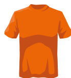
Игрок 2 из Команды А