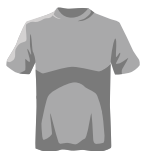
Игрок 2 из Команды Б