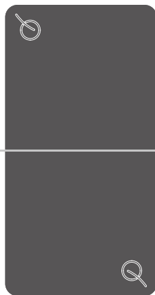
Игрок 2 из Команды А