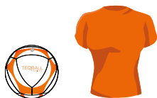
Игрок 1 из Команды А