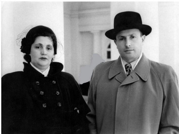
Мама и Папа. Кисловодск, 1956 год