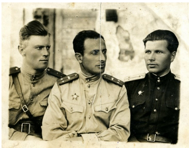
Папа на фронте