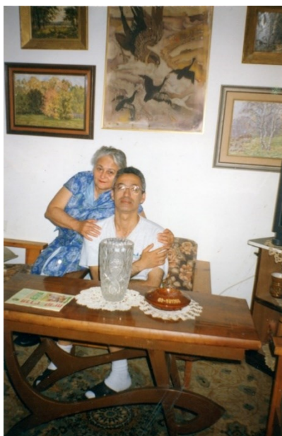
У Гаи в Герцлии