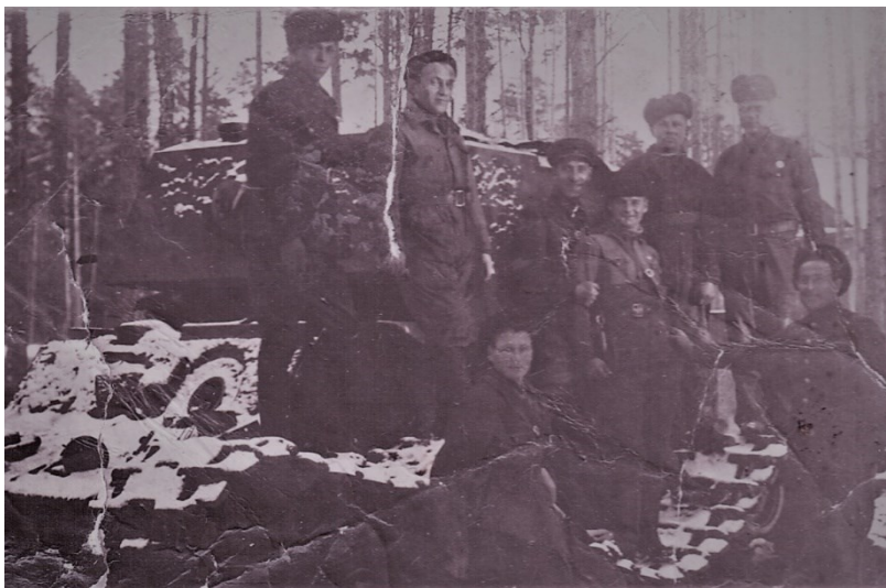
Папа крайний справа в фуражке

Именно в это время (август-сентябрь 1942 г.) стала востребованной, как никогда, гражданская специальность отца - механик-дизелист.