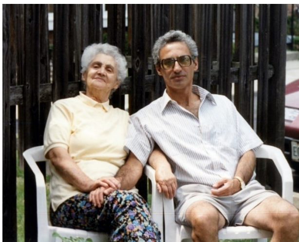
С мамой в Баффало, 1997