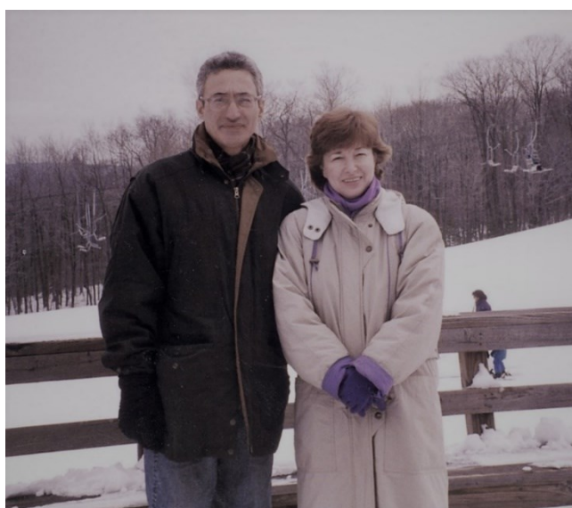
Моя первая зима в Америке, 1995