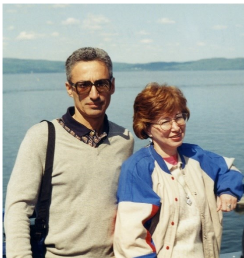
С Белой в Америке, Вермонт, 1996