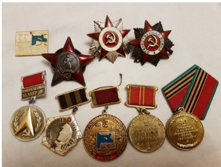
Папины боевые награды

происхождения предотвратить не удалось. Даже у отца в роте отравился метиловым спиртом сержант, прошедший всю войну