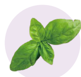
バジルエキス (トルジーエキス)