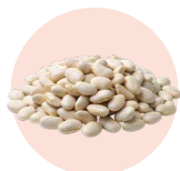
白インゲン豆エキス