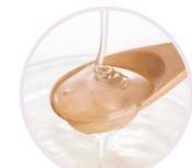
フラクトオリゴ糖